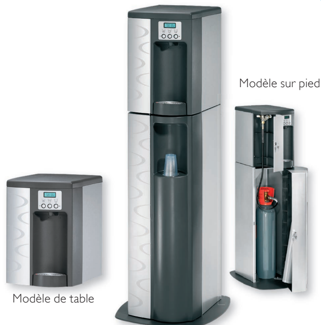
Modèle de table